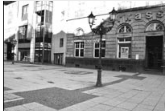
PLATZ DER STADT HOF oder Platz vor der Sparkasse?

der deutschen Teilung fast zu einem Vorort Berlins geworden. Wie viele Berliner mögen wohl in und um Hof im Franken-