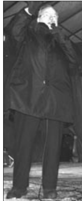
BÜRGERMEISTER in Aktion.

tungen sind in Neukölln bereits in vollem Gange.