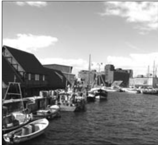
NICHT NUR BRASILIEN – Auch die Ostsee lädt zu verlängerten Ferien ein.

Der Unterschied zwischen dem Lehrer und dem Schüler, die beide aus dem selben Grund fehlten ist immens. Der Schüler hat in jeder Fehlstunde null Punkte erhalten, was ihm beim Abitur, das er bald vor sich hat, einige Probleme bereiten kann. Der Lehrer, der schon vor einigen Jahren die Schule erfolgreich beendet und das Studium auf Lehramt erfolgreich abgeschlossen hat, findet sich in einer ganz anderen Situation wieder. Mehr als böse Blicke von den Vorgesetzten und wenigen ArbeitskollegInnen kassiert er für seine Reise nicht. Im Gegenteil – ein gewisser Neid scheint unübersehbar. Da fragt sich doch der interessierte Mensch, inwiefern beide Fehlzeiten zu rechtfertigen sind und wie mit den unterschiedlichen Konsequenzen umgegangen werden soll. yr