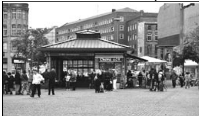
DER HERMANNPLATZ. Vor der Sanierung im Jahr 2024 wird der Platz von neuem Publikum bevölkert.