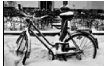
FAHRRAD festgefroren.

Doch der Umschwung hat auch seine Nachteile. Die Skiläufer müssen wieder auf andere Sportarten umsteigen. Jene, die das Glück haben, einen Schlitten zu besitzen, denn diese sind noch immer ausverkauft, können nicht mehr rodeln, denn es fehlt der Schnee. Ganz besonders schade ist der Schneeschwund für all jene, die gern mal über andere grinsen. Überall waren Frauen mit High-Heels zu sehen, die sich durch den Matsch quälten und überaus lustig hin und her schwankten. yr