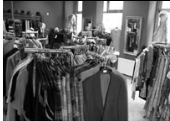
SECOND-HAND-LÄDEN machen gute Laune, findet Kiki.

angebotenen Accessoires, interessieren Kiki jedoch wenig. Ihr hat es das ge-