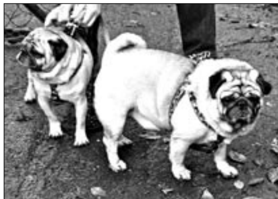
WIR DÜRFEN hier drauf. Wir sind niedriger als 35cm.