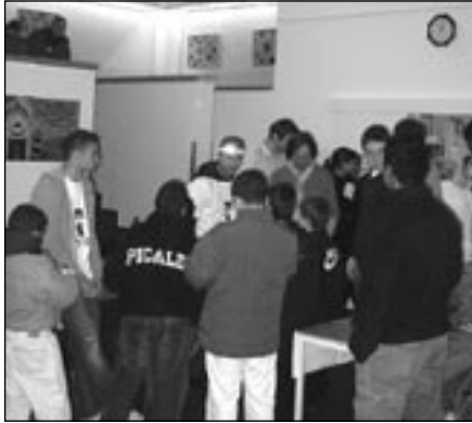
HERTHANACHWUCHS beim Mittagessen.

hen monatlich auf dem Programm, und nicht zu unterschätzen ist die Schülerhilfe, die vielen Rollberger Kindern