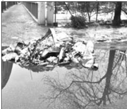
RESTMÜLL – auch dieser wurde bald beseitigt.

liegen an den Straßenrändern herum. Es war auch gerade erst Weihnachten