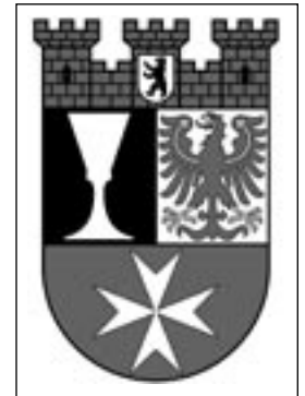
DAS NEUKÖLLNER WAPPEN.